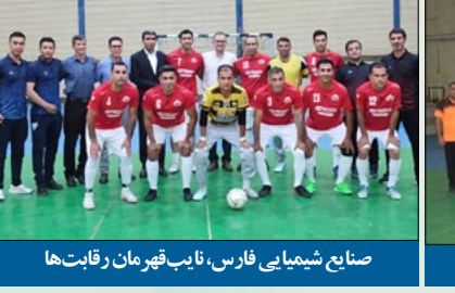
صنایع شیمیایی فارس، نایب قهرمان رقابت‌ها