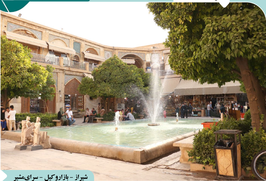
شیراز - بازار کبیل - سرای مشیر