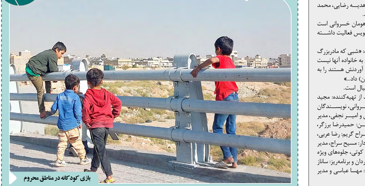
بازی کودکان در مناطق محروم