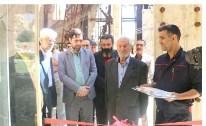
خوش‌نویسان به استقبال هفته حافظ رفتند تار و پود، میزبان خوش‌نویسان فارس

به گزارش اداره کل فرهنگ و ارشاد اسلامی فارس، نمایشگاه «استان حافظ» با رویکرد گرمیادداشت هفته حافظ در نگارخانه تار و پود، واقع در مرکز اسناد و کتابخانه ملی برگزار شد.