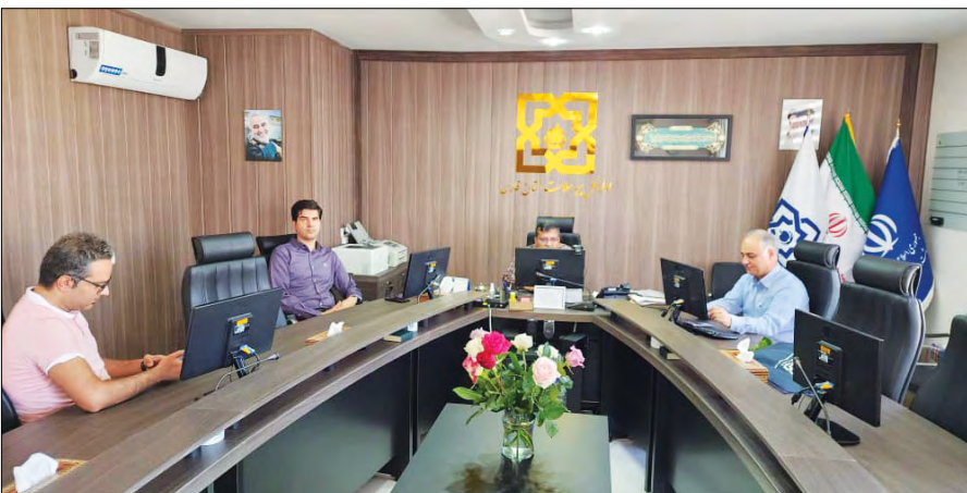
سال جاری سه دهک اول به صورت رایگان از پوشش‌های دهک‌های چهارم و پنجم نیز به این جمع پیوسته و سایر حمایتی بیمه سلامت برخوردار شدند و با گذشت چند ماه دهک‌ها هم از تخفیف‌ها و مزایای ویژه‌ای بهره‌مند شدند.