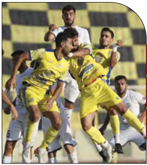
نگاهی به دو پیروزی شیرین در هفته هفتم لیگ یک: