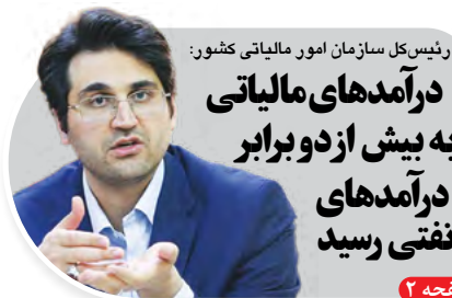
رئیس کل سازمان امور مالیاتی کشور: