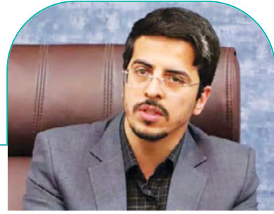
مدیرعامل شرکت شمشک‌های بین‌المللی فارس: برندهای ۷ استان کشور به شیراز آمدند