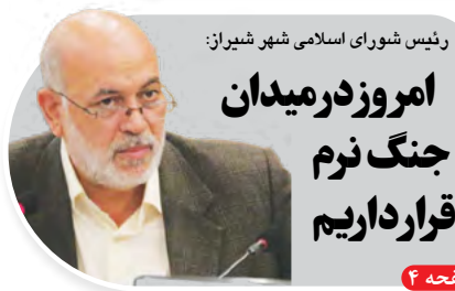
رئیس شورای اسلامی شهر شیراز: