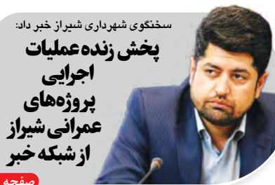
سختگوی شهرداری شیراز خبر داد: