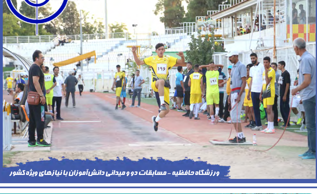
ورزشگاه حافظیه - مسابقات دو و میدانی دانش‌آموزان با نیازهای ویژه کشور