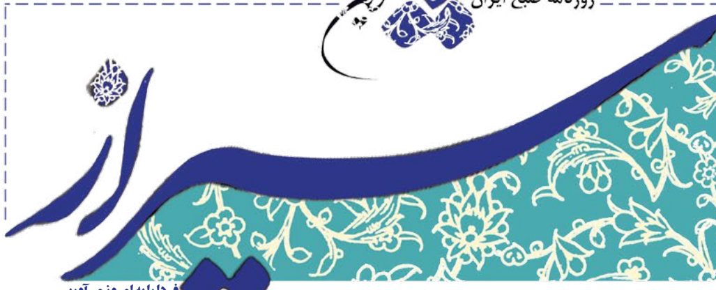
فردا را به امروز می‌آوریم