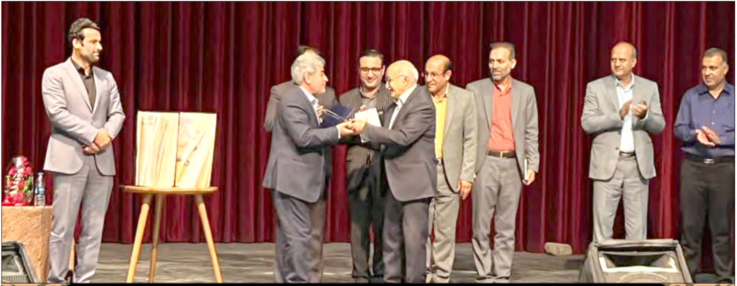
رئیس اداره فرهنگ و ارشاد اسلامی شهرستان مرودشت در آیین تجلیل از پیشکسوت رسانه‌های دیار تخت جمشید عنوان کرد: