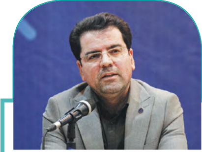
مدیرکل تأمین اجتماعی فارس خبر داد: