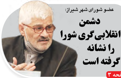
عضو شورای شهر شیراز: