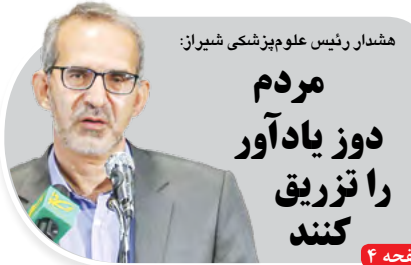
هشدار رئیس علوم پزشکی شیراز: