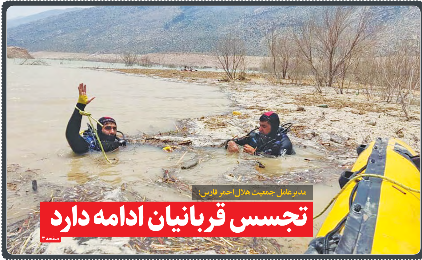
مدیرعامل جمعیت هلال احمر فارس: