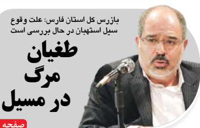
بازرس کل استان فارس: علت وقوع سیل استهبان در حال بررسی است