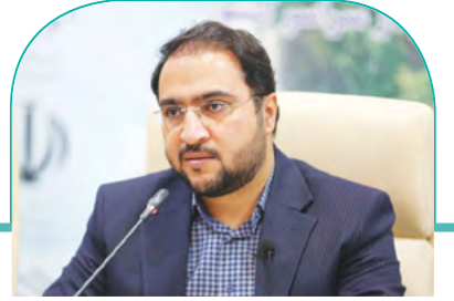
رئیس سازمان فرهنگی، اجتماعی و ورزشی شهرداری شیراز خبر داد: