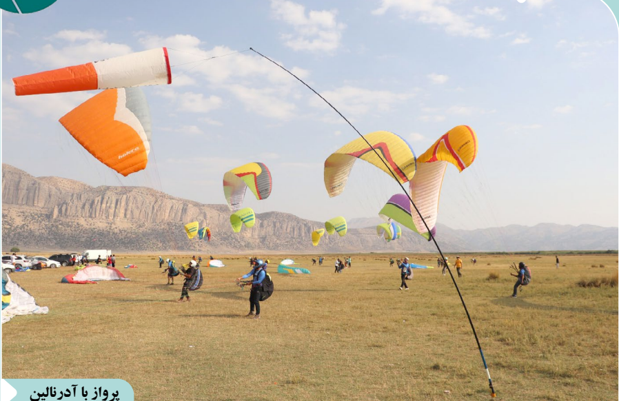
پرواز با آذرتالین