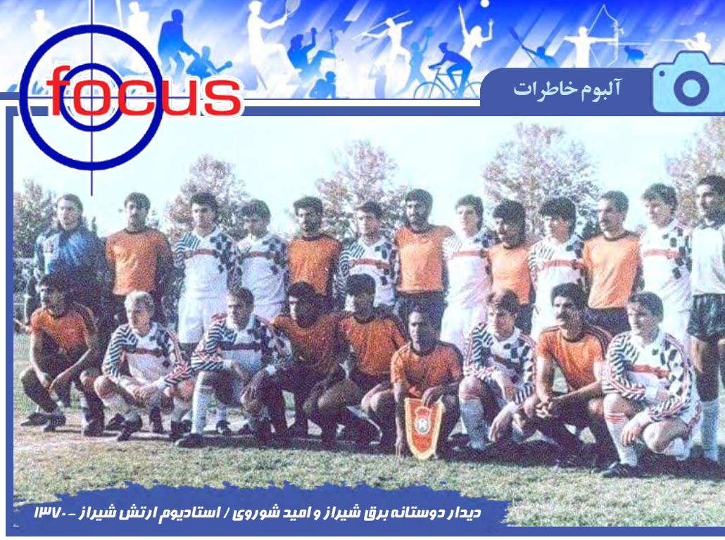
دیدار دوستانه برق شیراز و امید شوروی / استادیوم ارتش شیراز - ۱۳۷۰