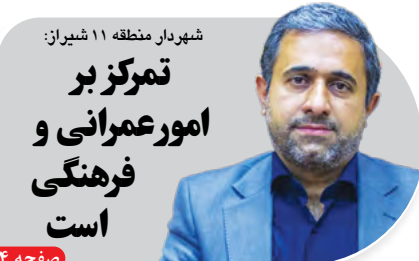
شهردار منطقه ۱۱ شیراز: