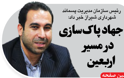
رئیس سازمان مدیریت پسماند شهرداری شیراز خبر داد: