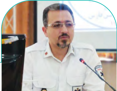
رئیس مرکز اورژانس دانشگاه علوم پزشکی شیراز خبر داد: