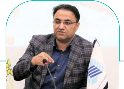
معاون مالی و اقتصادی شهرداری شیراز: