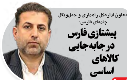
معاون اداره کل راهداری و حمل‌ونقل جاده‌ای فارس: