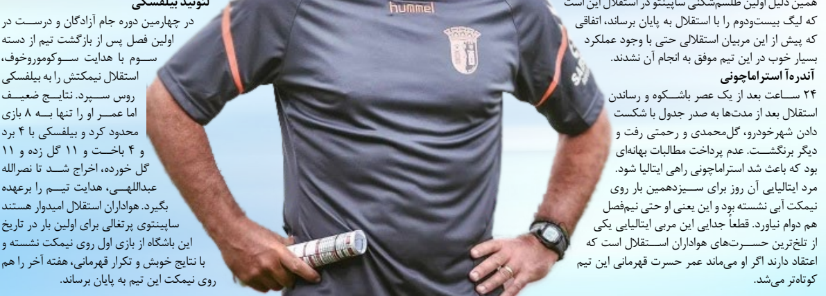
آندره استراماچونی ۲۴ ساعت بعد از یک عصر باشکوه و رساندن استقلال بعد از مدت‌ها به صدر جدول با شکست دادن شهرخوردو، گل‌محمدی و رحمتی رفت و دیگر برکنگست. عدم پرداخت مطالبات بهانه‌ای بود که باعث شد استراماچونی راهی ایتالیا شود. مرد ایتالیایی آن روز برای سیزدهمین بار روی نیمکت این تیمته بود و این یعنی او حتی نیم‌فصل هم دوام نیاورد. قطعاً جدایی این مربی ایتالیایی یکی از تلخ‌ترین حسرت‌های هواداران استقلال است که اعتقاد دارند اگر او می‌ماند عمر حسرت قهرمانی این تیم کوتاه‌تر می‌شد.

سایپنتو می‌تواند اولین مربی خارجی استقلال باشد که یک فصل کامل در این تیم مانده و همچنین جام را بالای سر ببرد. به گزارش فوتبال ۳۶۰ چه کسی فکرش را می‌کرد استقلال بعد از یک قهرمانی رویایی قرار است فصل جدید را با یک مربی جدید شروع کند. این اتفاق اما افتاد و حالا این ریکاردو سایپنتوی پرتغالی است که به جای فرهاد مجیدی روی نیمکت خواهد نشست. همیشه باید تغییر نیمکت از یک داخلی به مربی خارجی‌اش راضی بوده است. استقلالی‌ها امیدوارند که برای آن‌ها هم طلسم مربیان خارجی شکسته شود و آن‌ها از این تغییر در آینده به خوبی یاد کنند. مرد پرتغالی، هشتمین سرمربی خارجی تاریخ استقلال و چهارمین سرمربی آن‌ها در لیگ برتر است. در تاریخ لیگ برتر، هرگز یک مربی خارجی نتوانسته از ابتدا تا انتهای یک فصل روی نیمکت استقلال دوام بیاورد و به دلیل نتایج ضعیف، اصلاح ساختار و یا مسائل مالی، رفیق نیمه‌راه بوده است. به همین دلیل اولین طلسم‌شکنی سایپنتو در استقلال این است که لیگ بیست‌ودوم را با استقلال به پایان برساند. اتفاقی که پیش از این مربیان استقلالی حتی با وجود عملکرد بسیار خوب در این تیم موفق به انجام آن نشده‌اند.