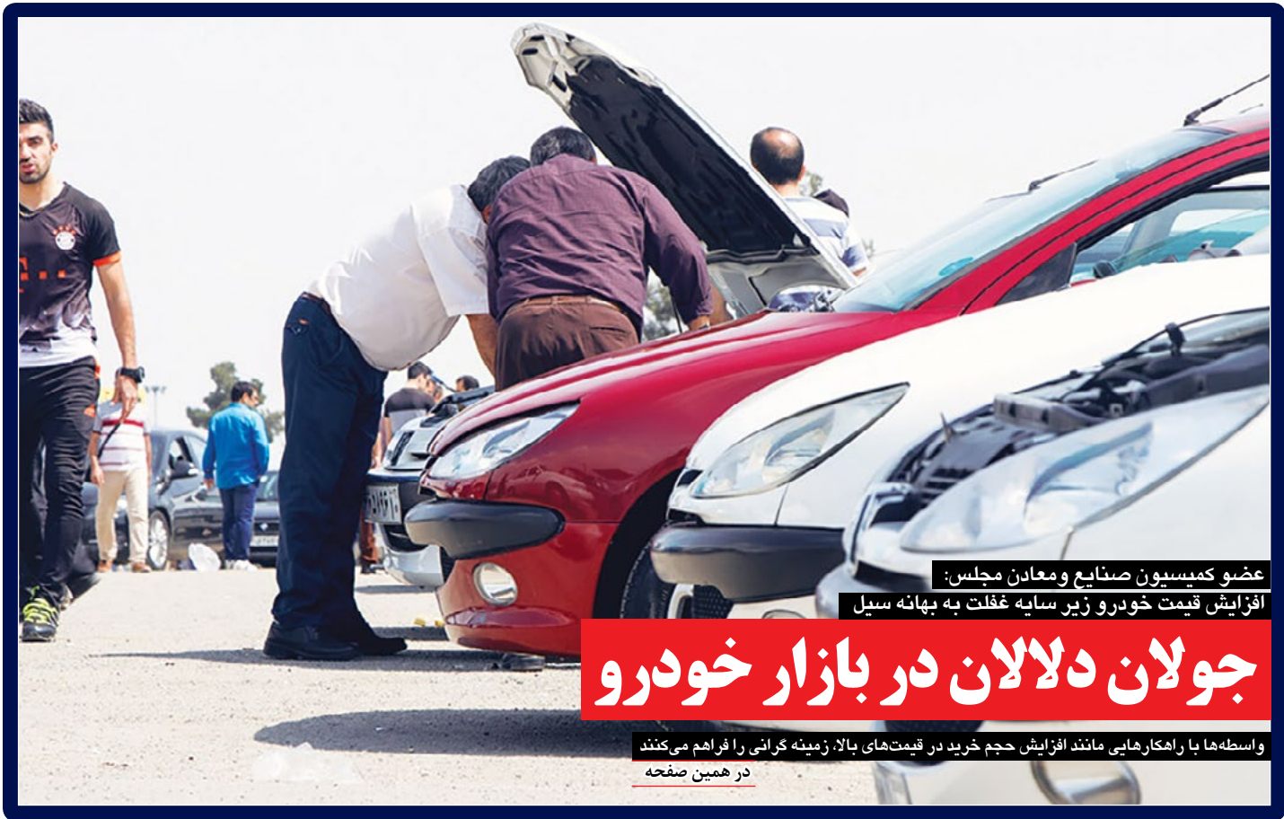
عضو کمیسیون صنایع و معادن مجلس: افزایش قیمت خودرو زیر سایه غفلت به بهانه سیل