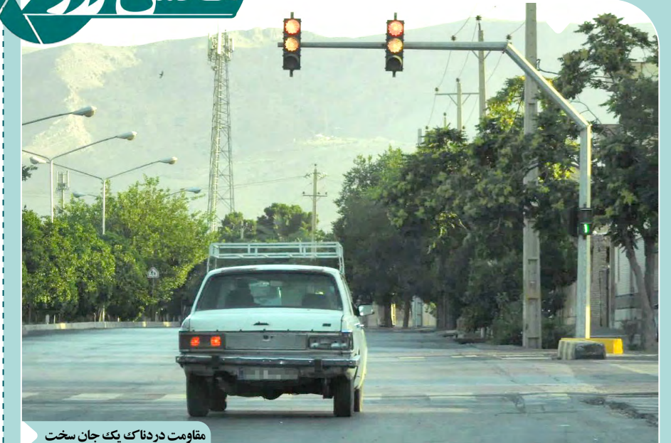
مقاومت دردناک یک جان سخت