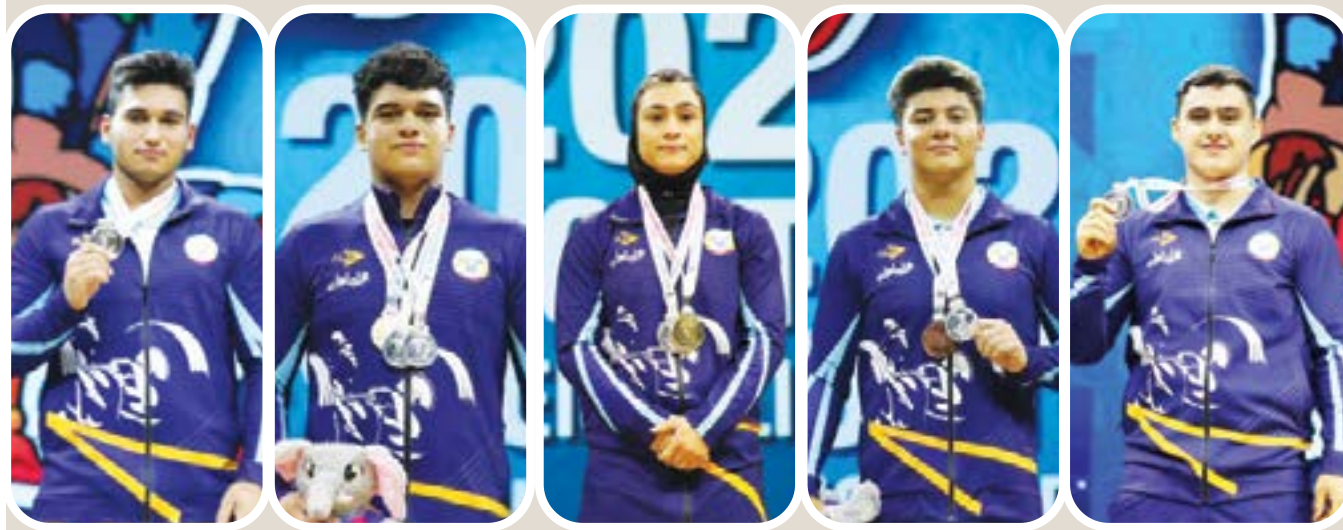
وزنه برداری قهرمانی نوجوانان و جوانان آسیا ۲۰۲۳

فرصت پذیرهنویسی و افزایش سرمایه تا پایان مرداد در صفحه آخر