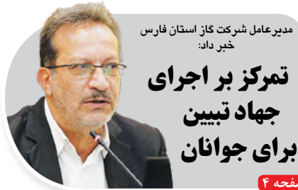
مدیر عامل شرکت گاز استان فارس خیر داد: