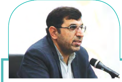
رئیس دانشگاه آزاد اسلامی فارس: