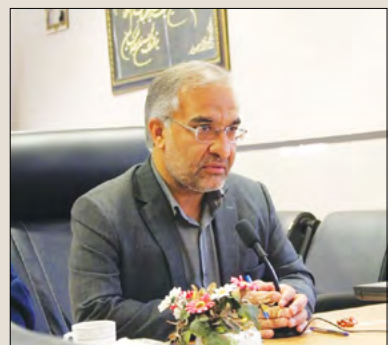
مدیرکل آموزش و پرورش فارس تأکید کرد:

خواهد داشت. عسکری ضمن گرمیادداشت یاد و خاطره پرستارانی که جان عزیز خود را در شرایط کرونایی از دست دادند، گفت: کارهای همراه با محبت پرستاران همواره باعث دلگرمی مردم بوده است و قدر دان زحمات این عزیزان هستیم و این روز را به نمایندگی از دانش‌آموزان و اولیای آنها و معلمان استان فارس به همه پرستاران تبریک می‌گویم.