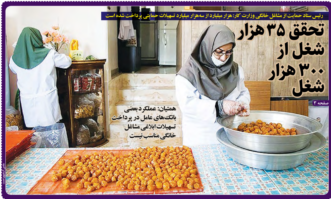
رئیس ستاد حمایت از مشاغل خانگی وزارت کار: هزار میلیارد از سه هزار میلیارد تسهیلات حمایتی پرداخت شده است