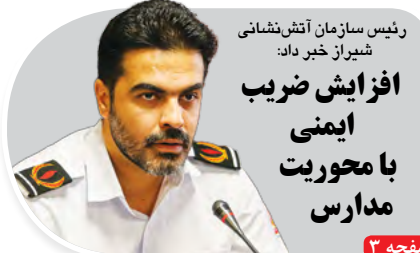
رئیس سازمان آتش‌نشانی شیراز خیر داد: