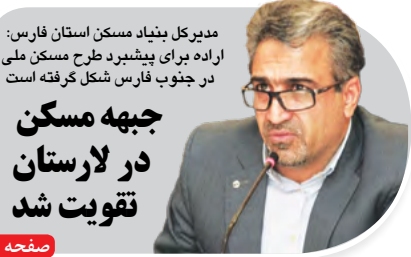
مدیرکل بنیاد مسکن استان فارس: اراده برای پیشبرد طرح مسکن ملی در جنوب فارس شکل گرفته است