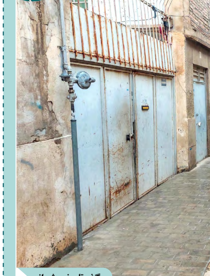
گذر تاریخی شیراز